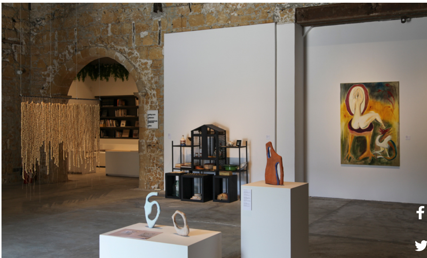
Έργα από την έκθεση «Seeking Roots»