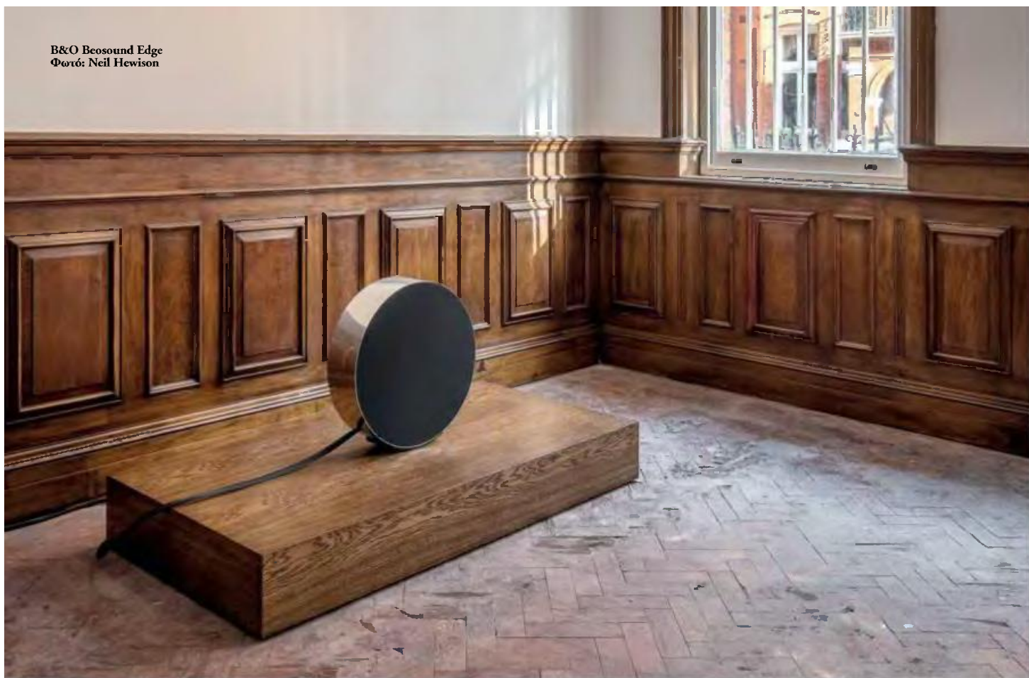
B&O Beosound Edge