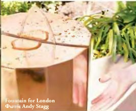
Fountain for London