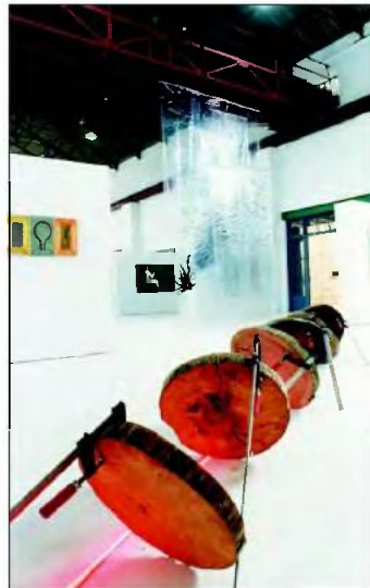
Από την πρώτη έκθεση στο NiMAC Το Δέντρο Πηγή Έμπνευσης, Αφορμή Δημιουργίας .

Μια οπτικοακουστική αναδρομή στην πολυχρονη ιστορία του Κέντρου Τεχνών μέσα από το πλούσιο αρχείο του NiMAC. Η έκθεση άνοιξε τις πύλες της για το κοινό στις 15 Οκτωβρίου 2 και θα ολοκληρωθεί στις 30